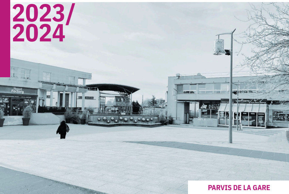
PARVIS DE LA GARE