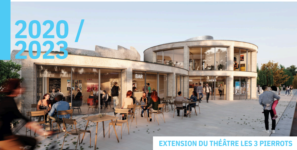
EXTENSION DU THÉÂTRE LES 3 PIERROTS